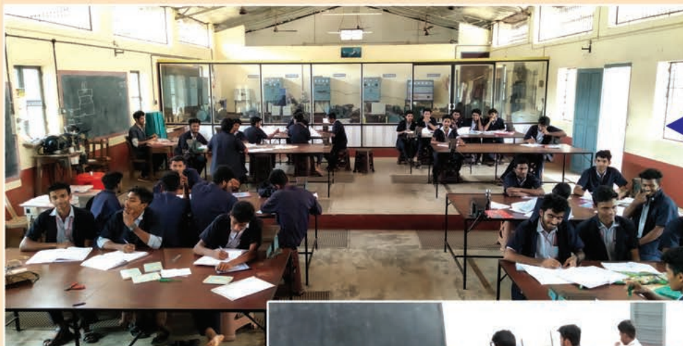
← ELECTRICIAN'S LAB