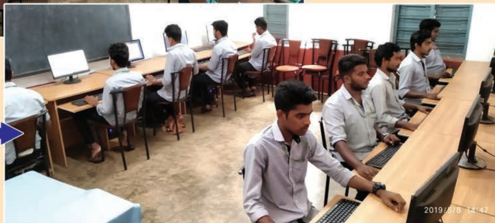
COMPUTER LAB →